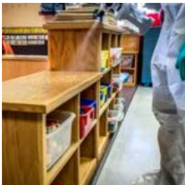
ALOJAMENTO E EDUCAÇÃO