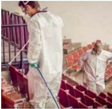
INSTALAÇÕES E PAVILHÕES DESPORTIVOS